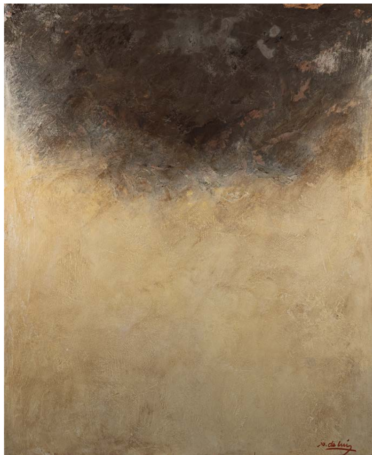
Serie Walling Técnica mixta sobre táboa 73 × 60 cm

o absurdo ser humano) ou necrolóxicas grotescas e rebeldes coas que erguer no seu taller secretos relatos literarios ou a obra plástica que agora coñecemos. A obra de madurez dun pintor ferozmente imaxinativo que titula as súas pinturas, series e mostras con mestizos enunciados e neoloxismos descubertos nas ruínas da aldea global, como On the road , O Tour d'Ancares e mais este Walling (“mureando”) co que Xoti de Luis, toujours on the road , nos agasalla. No ámbito discursivo, o vínculo progreso-vanguardia, caro á historiografía formalista, bate aquí cos muros da tradición, coas permanencias do noso mundo rural e rururbano.