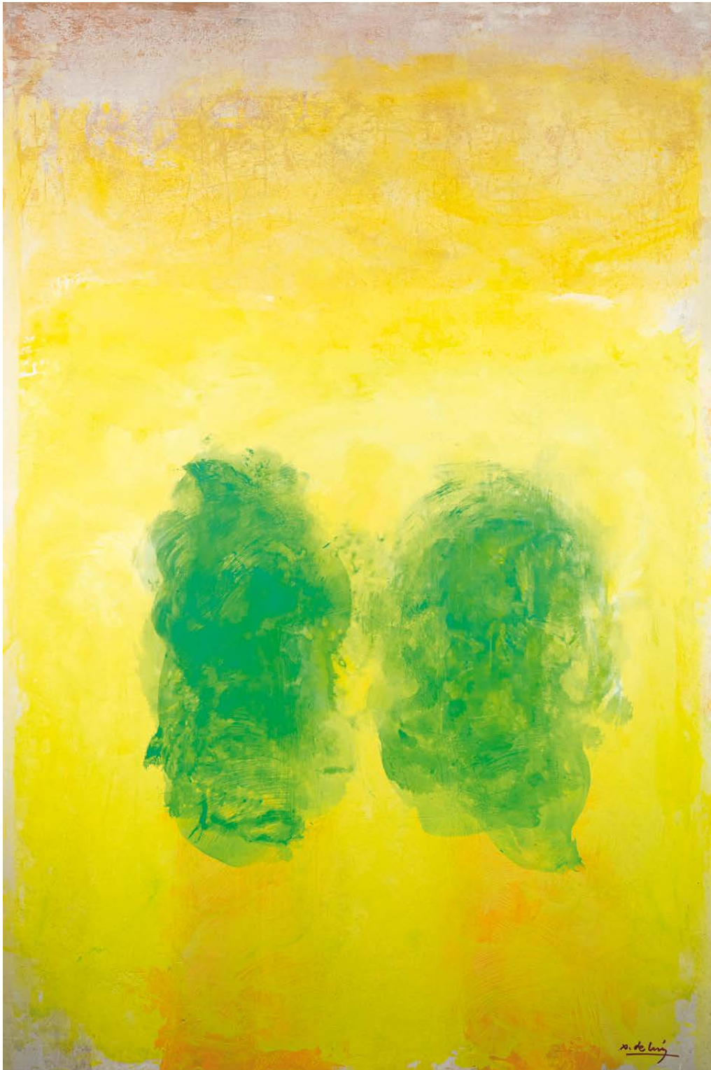
Walling Técnica mixta sobre táboa 120 × 80 cm