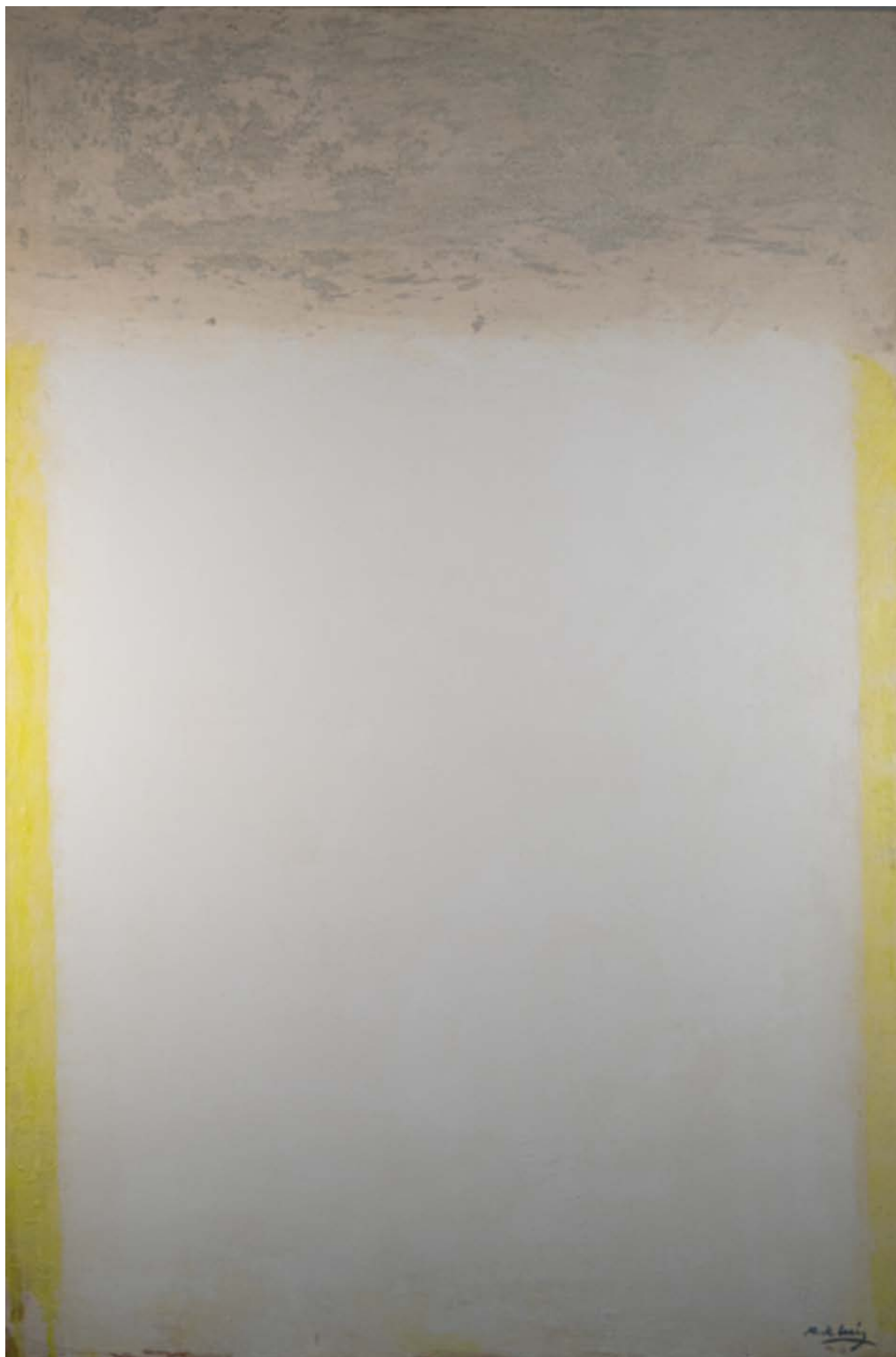
Walling Técnica mixta sobre táboa 120 × 80 cm