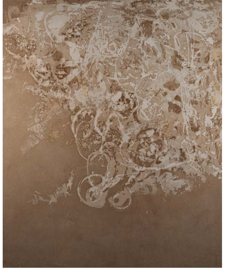
Serie Walling Técnica mixta sobre táboa 73×60 cm