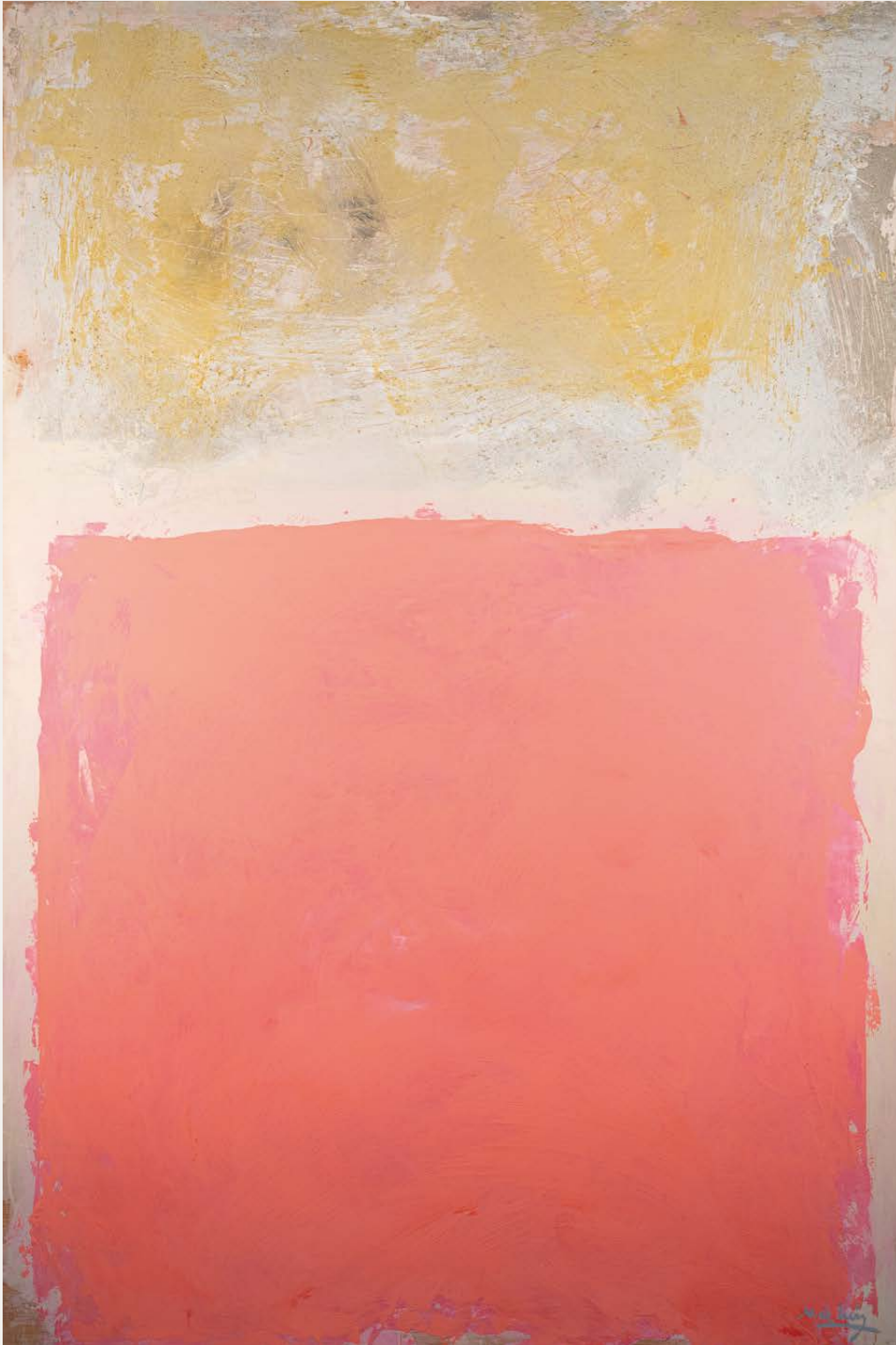
Walling Técnica mixta sobre táboa 120 × 80 cm