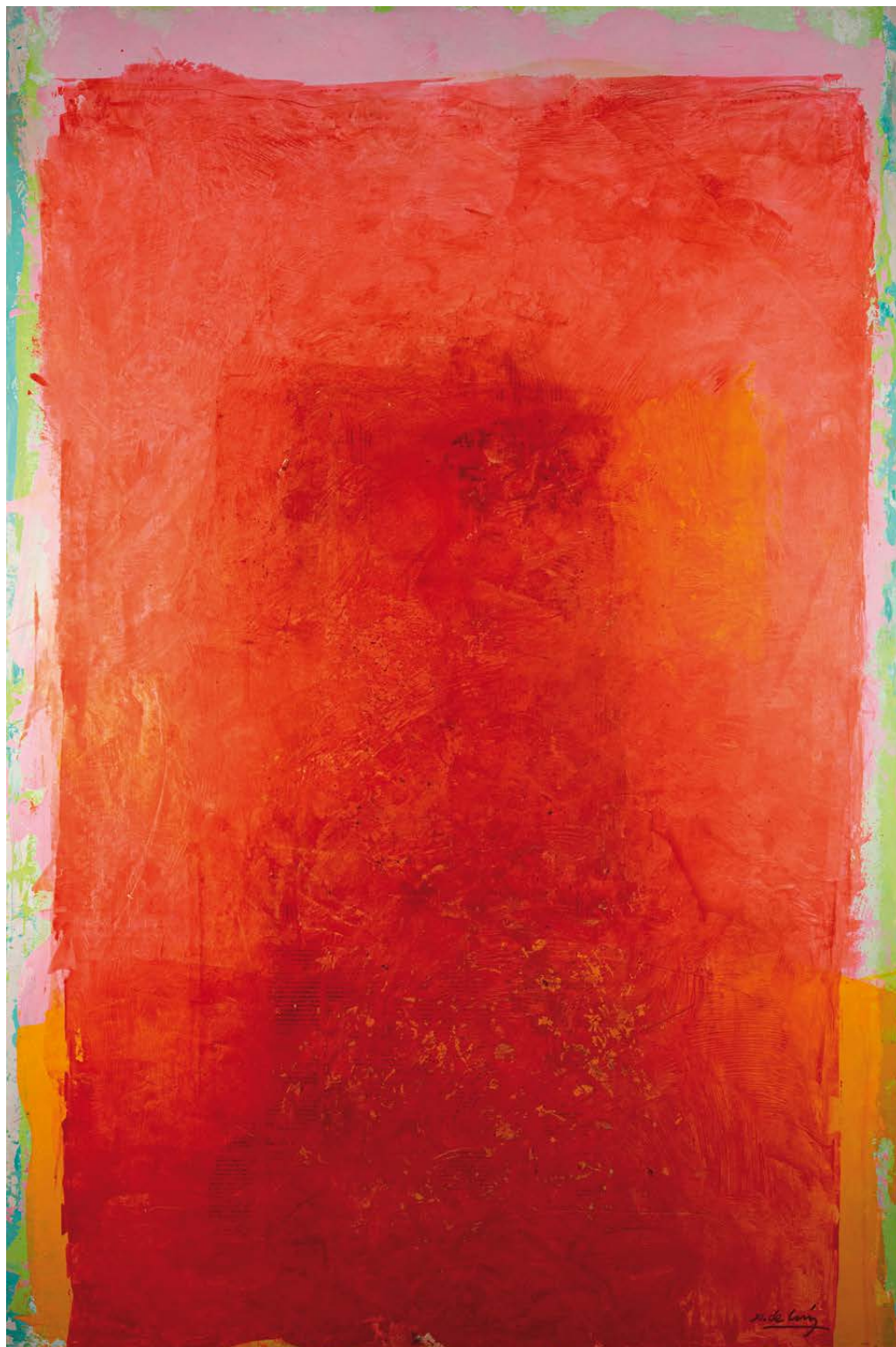
Walling Técnica mixta sobre táboa 120 × 80 cm