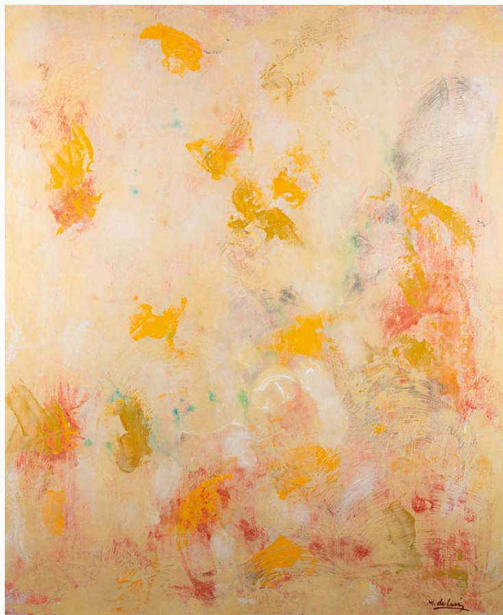
Série Walling Técnica mixta sobre táboa 73×60 cm