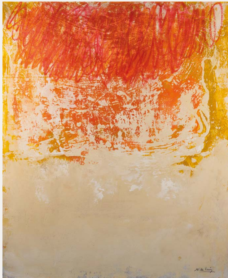
Serie Walling Técnica mixta sobre táboa 73 × 60 cm