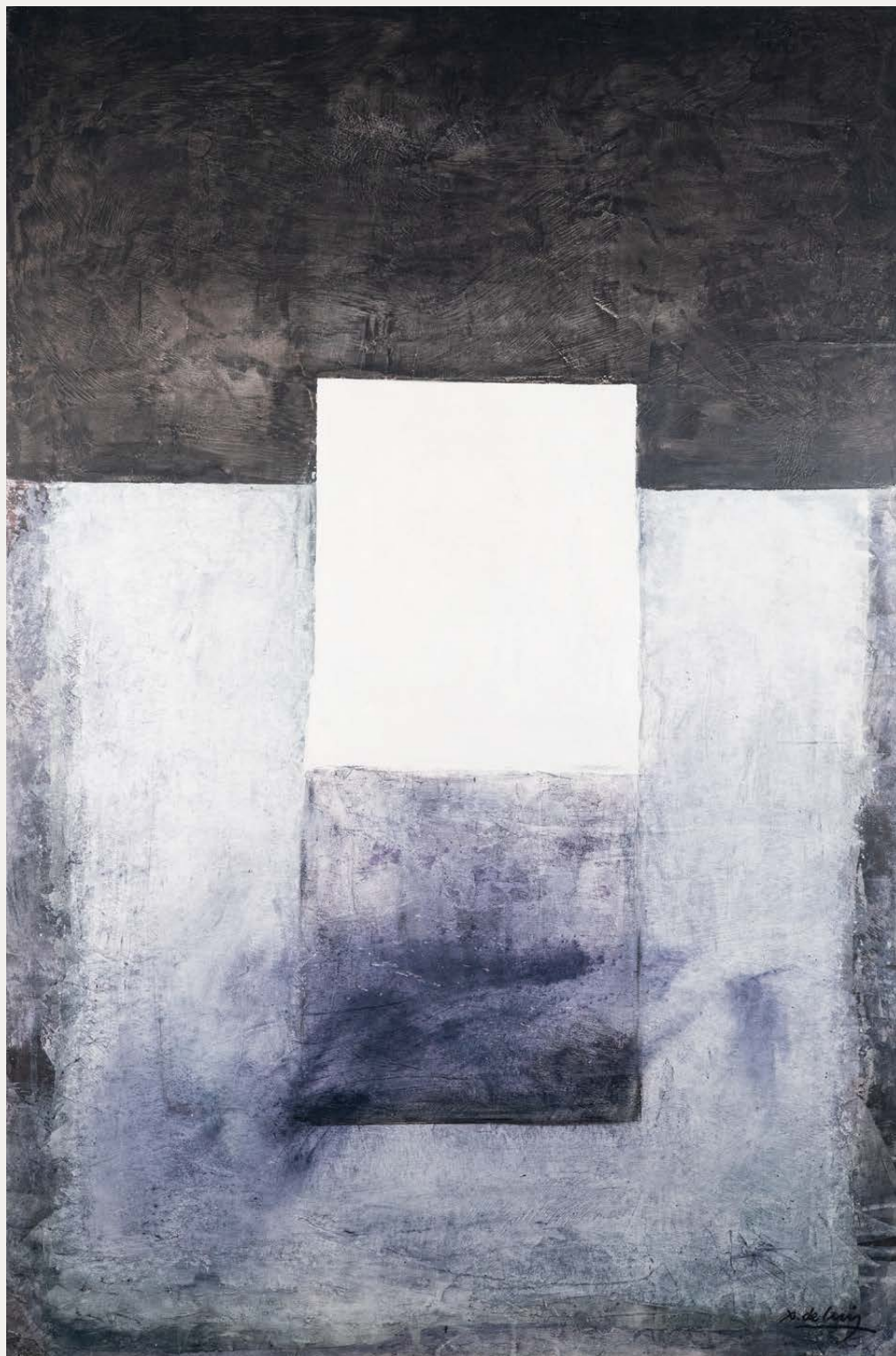
Walling Técnica mixta sobre táboa 120 × 80 cm