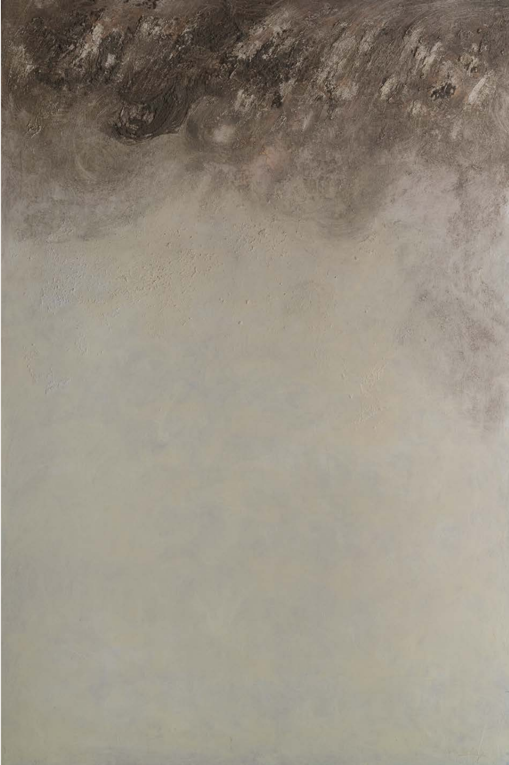
Walling Técnica mixta sobre táboa 150 × 90 cm