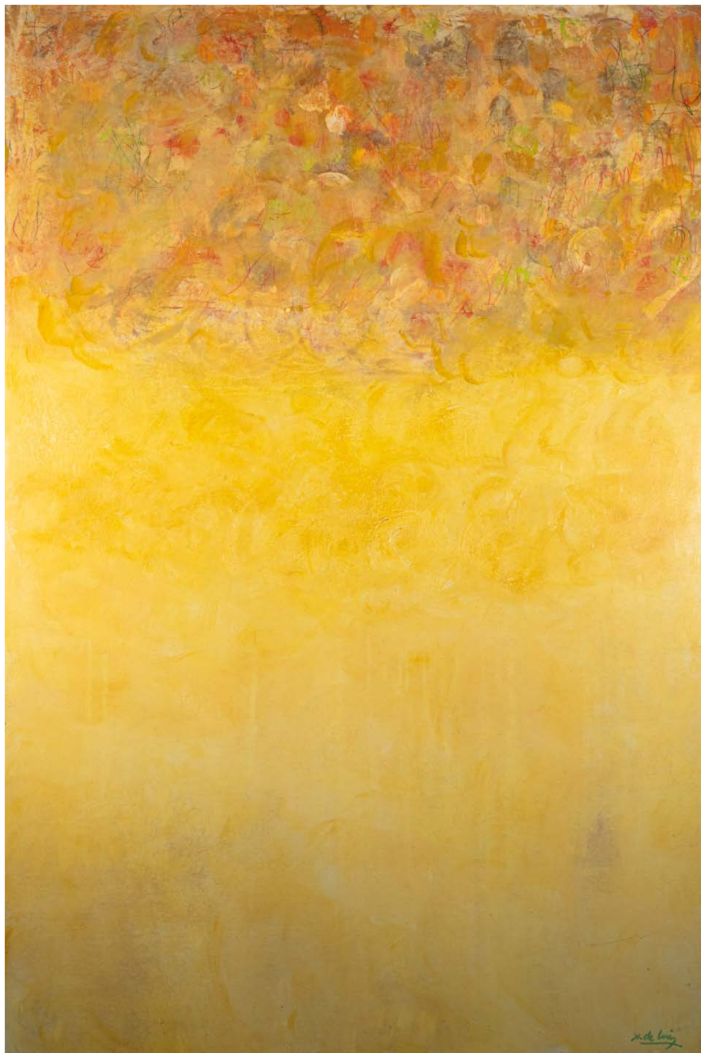
Walling Técnica mixta sobre táboa 120 × 80 cm