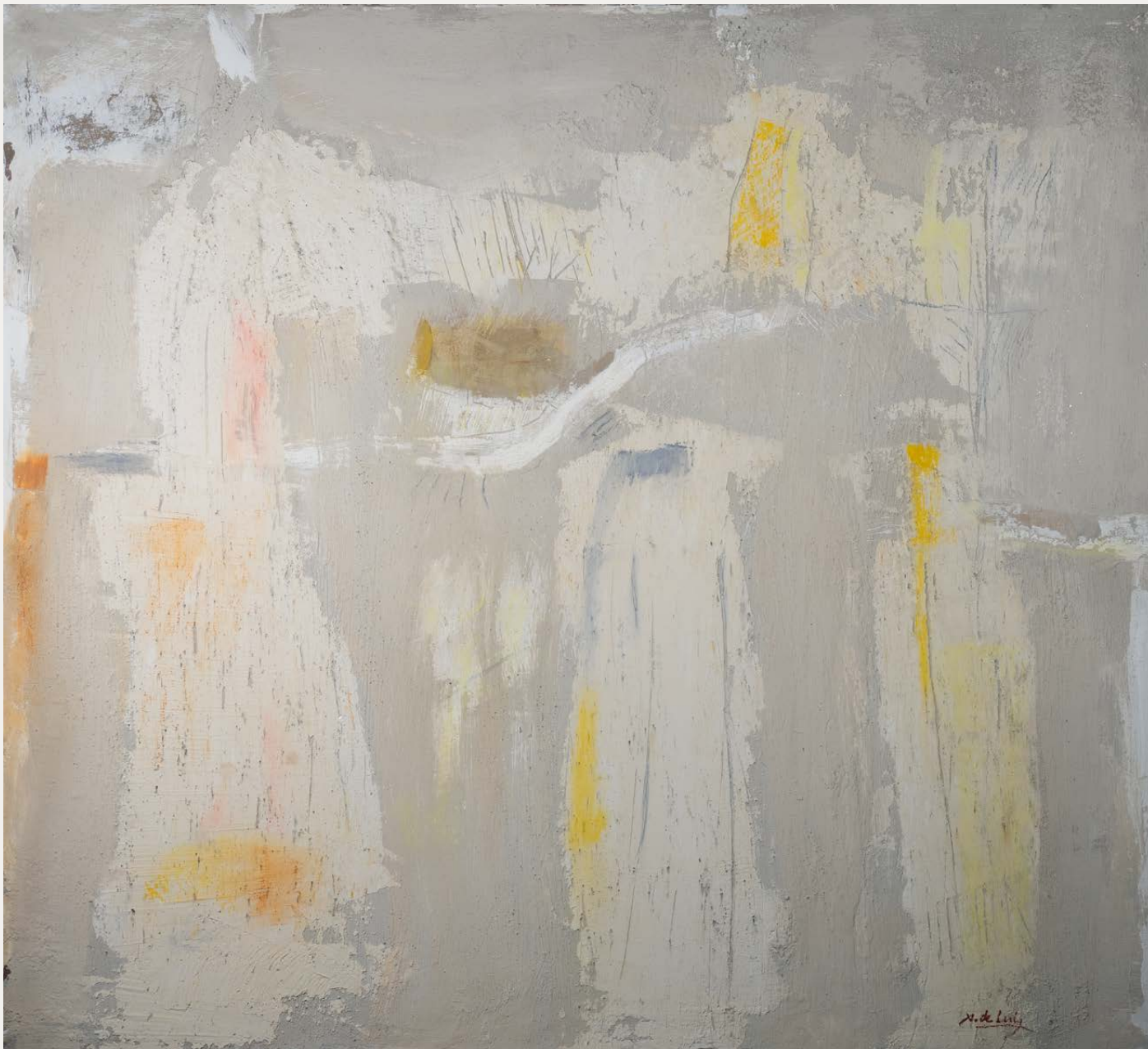
Walliñeiros Técnica mixta sobre táboa 100 × 110 cm