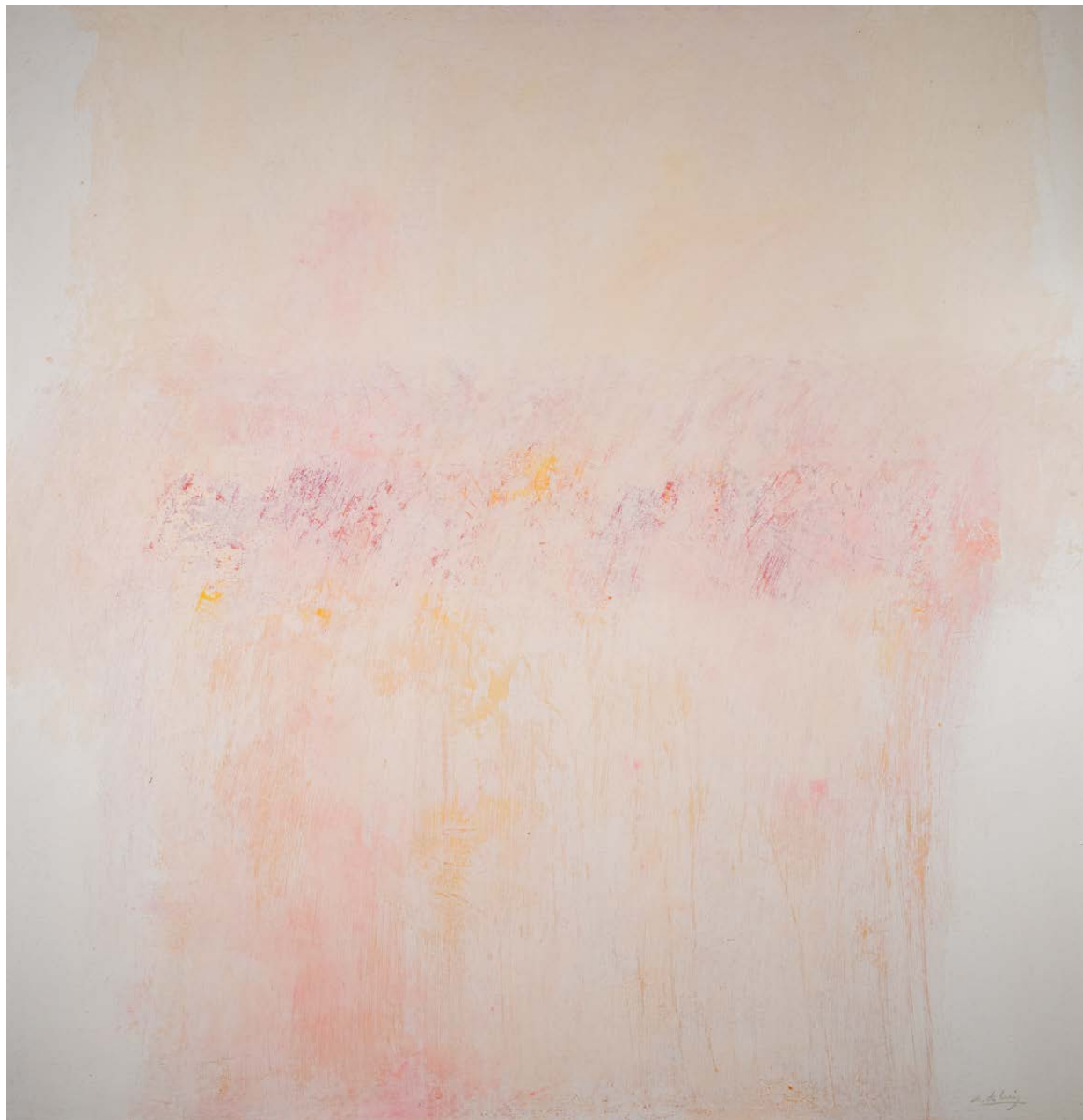
Walling Técnica mixta sobre táboa 122 × 125 cm