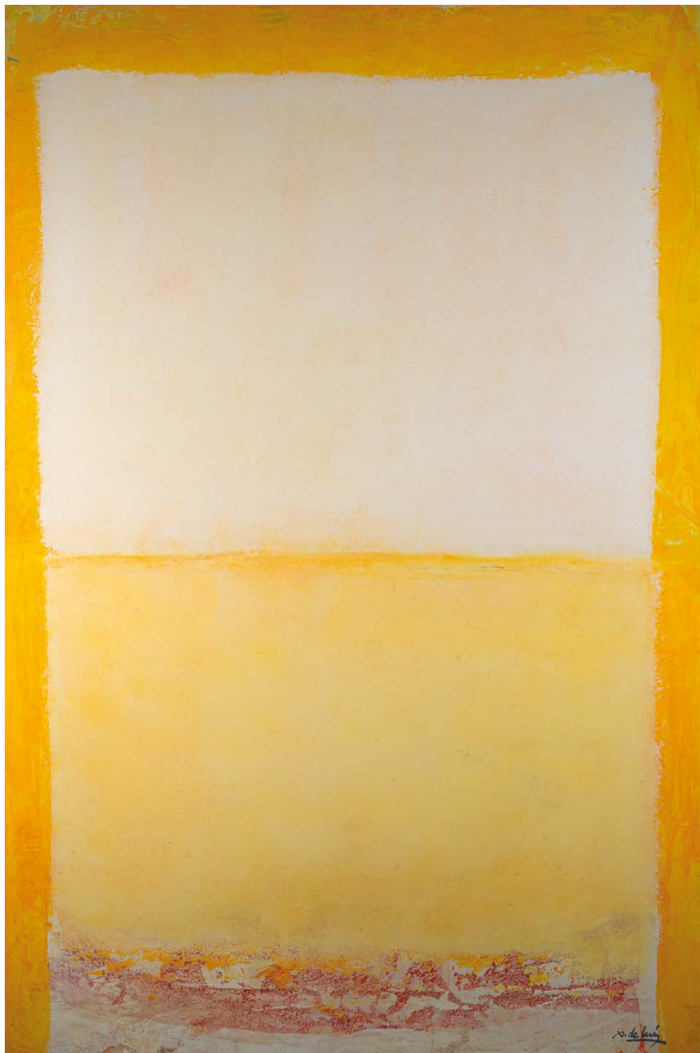
Walling Técnica mixta sobre táboa 120 × 80 cm