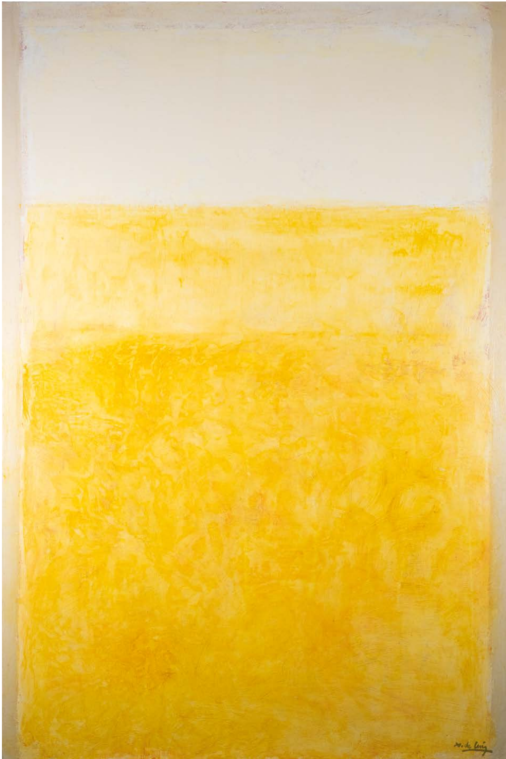
Walling Técnica mixta sobre táboa 120 × 80 cm