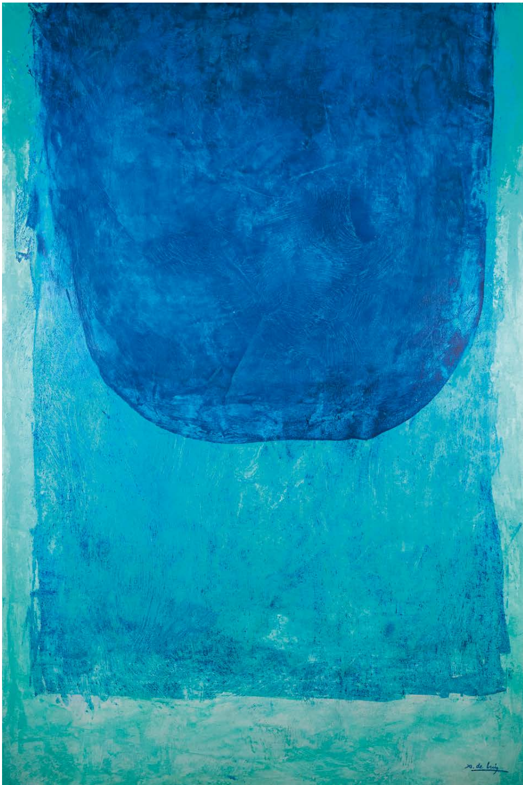
Walling Técnica mixta sobre táboa 120 × 80 cm